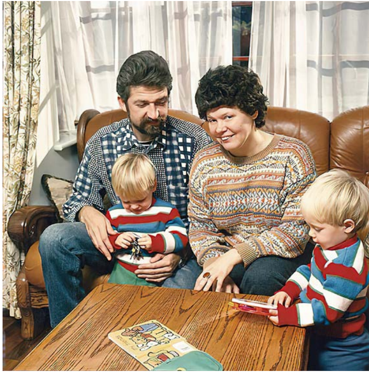
Ирина Ратушинская с мужем и детьми