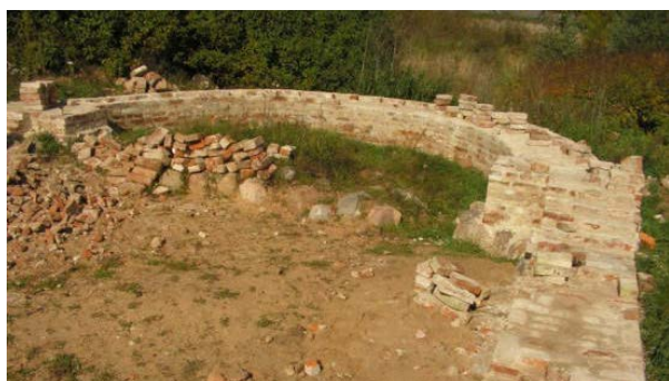
Расчищенный фундамент Покровского храма. 2009 г.