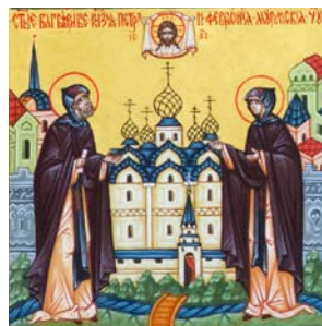
Святые благоверные князя Петр и Феврония