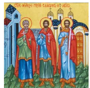
Мученики Гурий, Самон и Авив