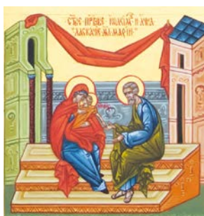
«Ласкание младенца Марии»