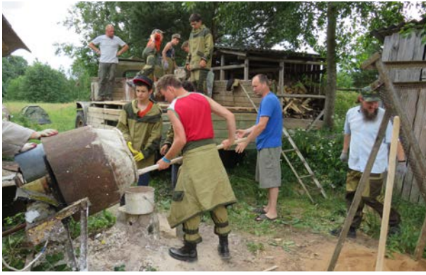
Приготовление вапняного теста

лись на славу: копали глину, участвовали в обжиге партии из двух с половиной тысяч крупных кирпичей (как это происходит, подробно опишем в следующей заметке), перевезли и перебросили на строительные леса кирпичи для дальнейшей кладки, помогли приготовить известковый раствор (и в процессе работы убедились, что все строительные материалы у нас под ногами, привозная только известь), очистили четве-