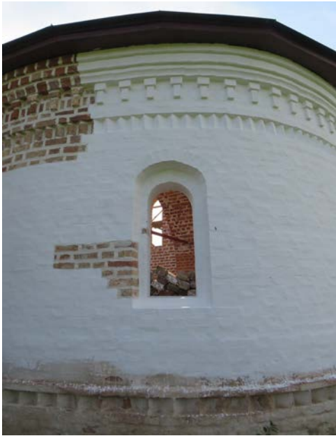
Восстановленная алтарная абсида. Июнь 2020 г.

военные годы использовали под клуб и зернохранилище. Летом 1941 года во время немецкого наступления здание было повреждено, но после войны отремонтировано. В период хрущевских гонений храм значительно пострадал и к началу 90-х годов представлял собой руины.