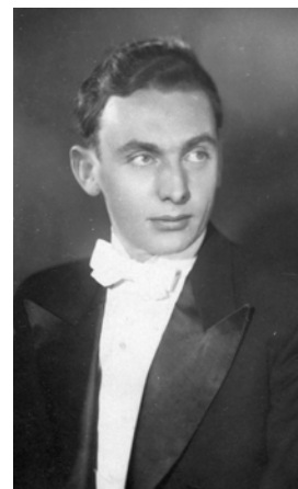
Юрий Всеволодович Гамалей