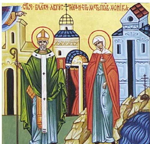
Блаженный Августин с матерью святой Моникой