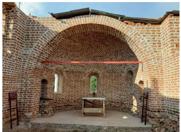
Интерьер абсиды после уборки