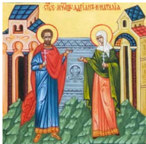
Мученики Адриан и Наталия