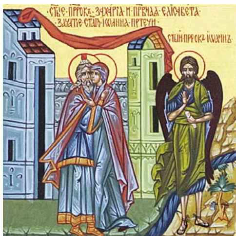
Зачатие Иоанна Предтечи