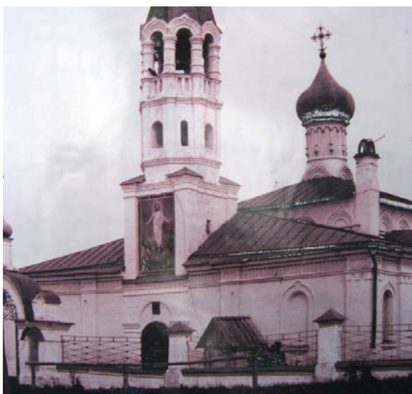
Фото 1908 года