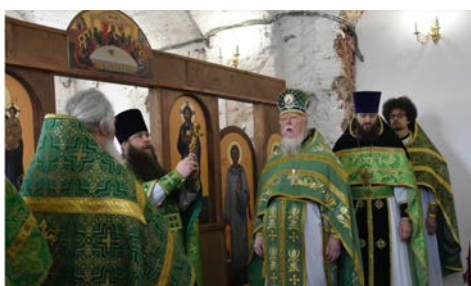
День памяти преподобного Алексия