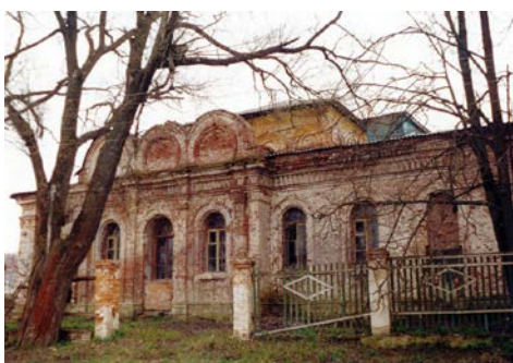
Храм до реставрации