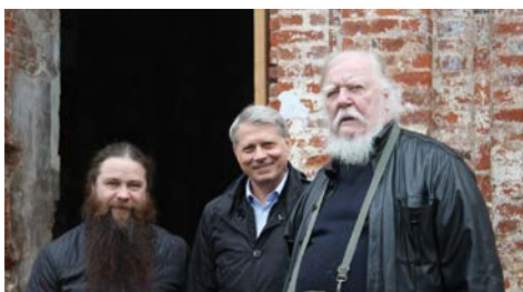
В 2017 году