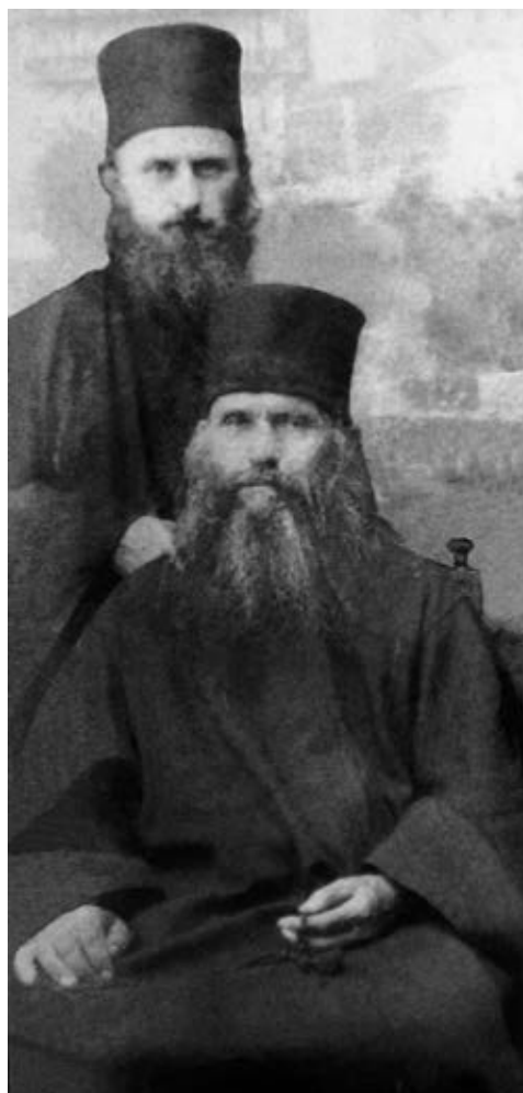
С преподобным Силуаном Афонским

жизнь показала мне, что вне живого опыта Бога или встречи с властями и мироправителями тьмы века сего, духами злобы поднебесными (Еф. 6: 12), одна интеллектуальная осведомленность не приводит к тому, что является смыслом веры нашей: знание Бога, сотворившего все сущее. «Знание» — как вхождение в самый Акт Его Вечности: «Сия есть жизнь вечная, да знают Тебя, единого истинного Бога, и посланного Тобою Иисуса Христа» (Ин. 17: 3). В часы, когда ко мне прикасалась Любовь Божия, я «узнавал» в ней Бога: «Бог есть любовь, и пребывающий в любви пребывает в Боге, и Бог в нем» (1 Ин. 4: 16). После же посещения Свыше я читал Евангелие