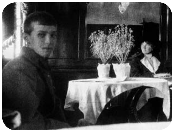
Цесаревич Алексей и великая княжна Ольга. Река Иртыш, пароход «Русь». 20–22 мая 1918 г.

Вся провизия, присланная их высочествам местными жителями, Ивановским монастырем и заключающаяся в ледниках с молоком, квасом, творогом, пирогами и печеньем, была отобрана красногвардейцами в свое пользование. Они выдавали им только немного молока, а у баронессы Буксгевден нашлось в кармане несколько холодных зраз и сладких кексов. Это было все их питание.