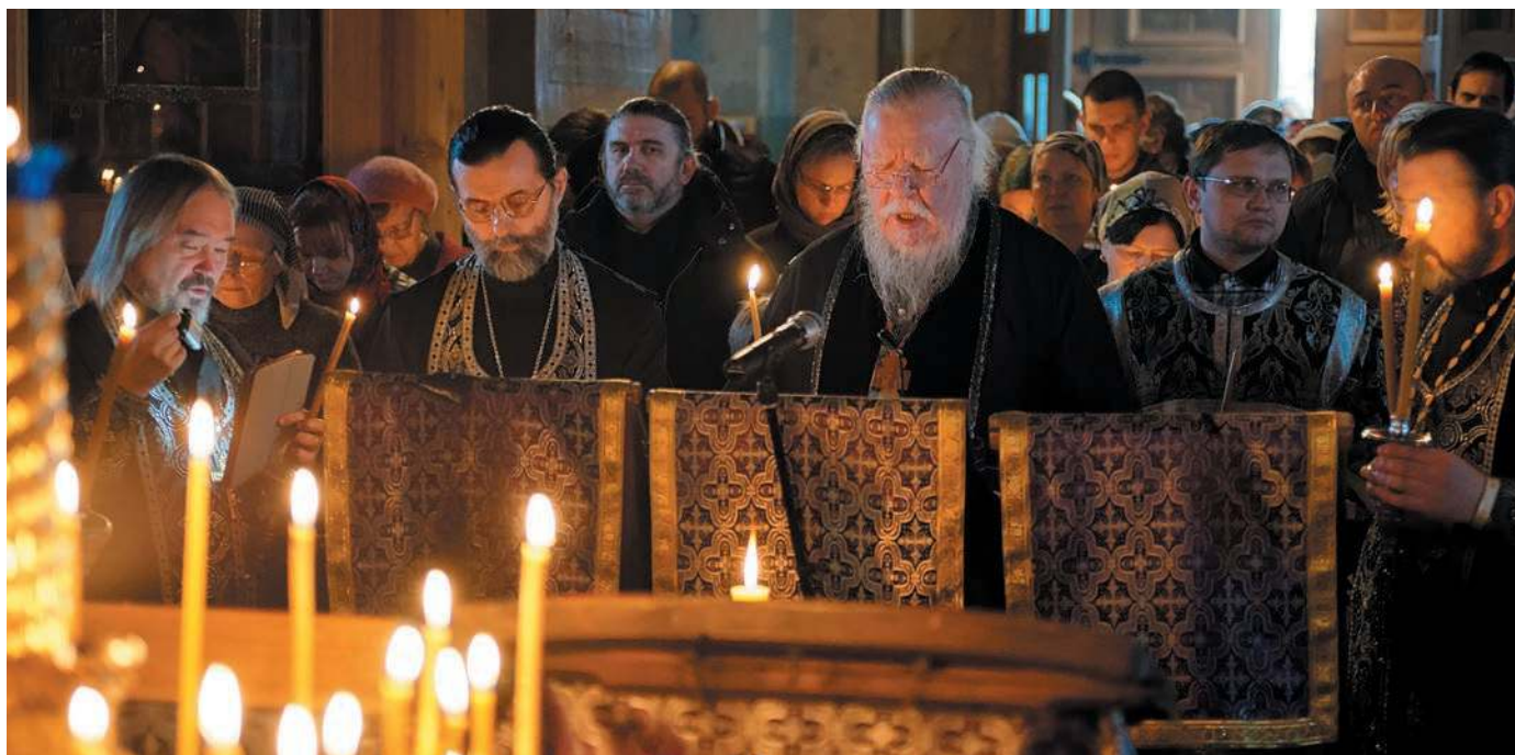
ВЕЛИКИЙ КАНОН АНДРЕЯ КРИТСКОГО В БЛАГОВЕЩЕСКОМ ХРАМЕ