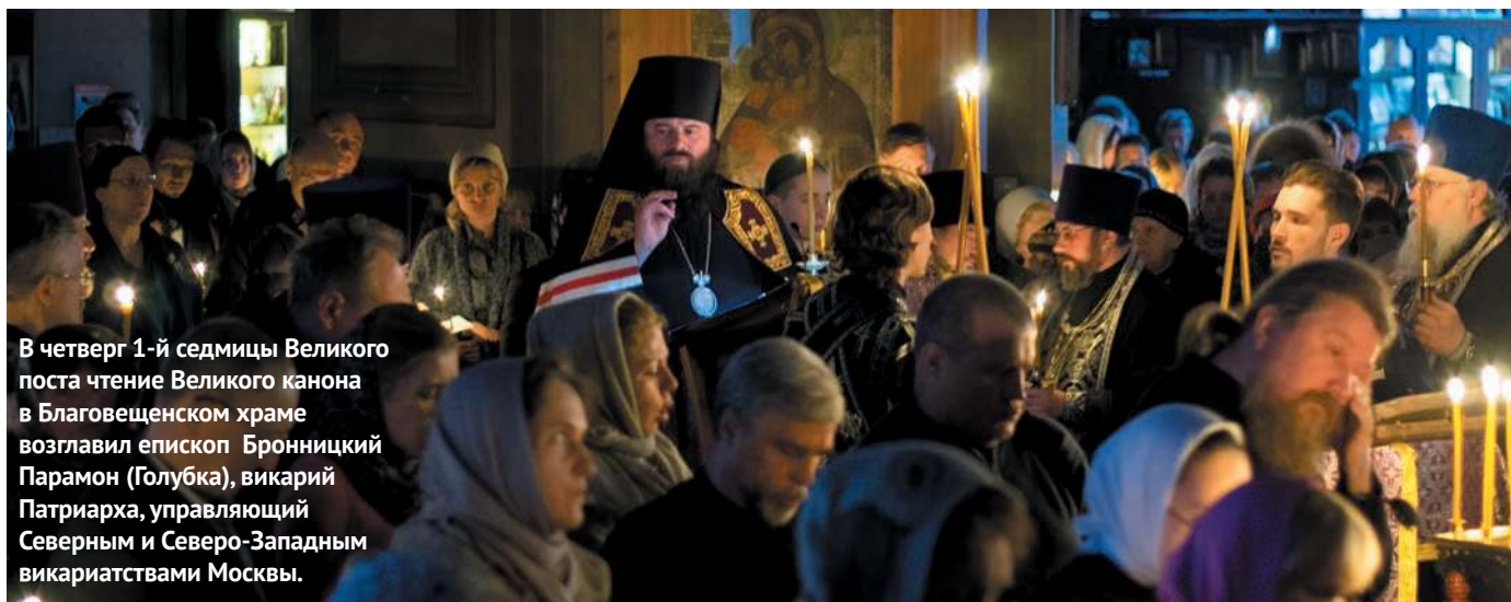
В четверг 1-й седмицы Великого поста чтение Великого канона в Благовещенском храме возглавил епископ Бронницкий Парамон (Голубка), викарий Патриарха, управляющий Северным и Северо-Западным викариатствами Москвы.